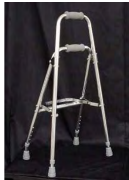
ウォーカーケイン （非常に安定がよく、 多少もたれても大丈夫）