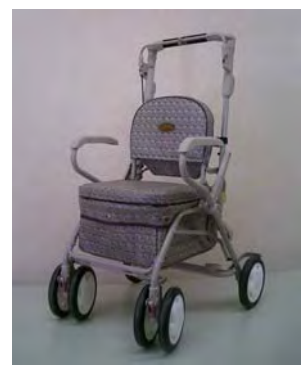
シルバーカー （荷物を運んだり、腰掛 けて休める。避難所、施 設内でも使える）