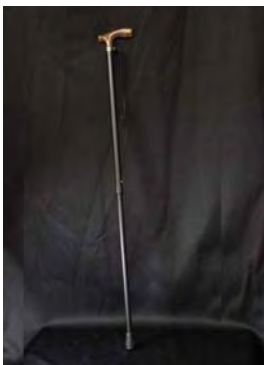
T字杖 （これだけと 考えないように）