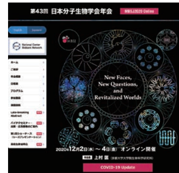
日本分子生物学会年会HPにバナー広告を出稿

※今後の新型コロナ感染状況により、予定は変更になる可能性があります。当該学会のHPで最新情報をご確認下さい。