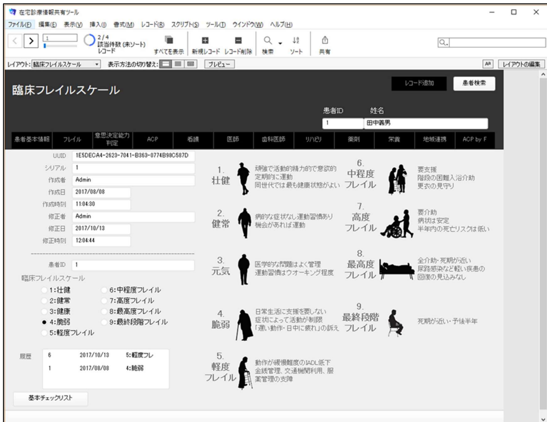
図 1. 多職種連携 ICT ツールのフレイル評価の見本画面

Rockwood らによる臨床フレイル・スケールが、イラスト付きで表示されている。医療者だけでなく、介護職・患者・家族もイラストから直感的にフレイルを評価できる。