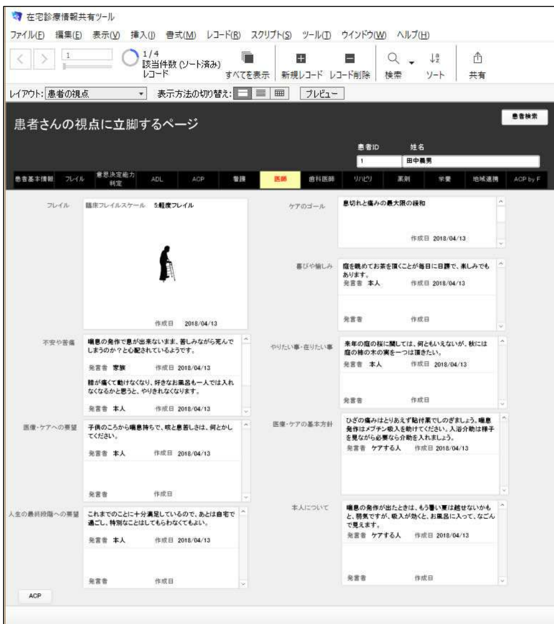
図 2. 患者視点に立脚したサマリー・ページの試作

フレイル評価を軸として、ACP のコミュニケーションを中心に、患者本人と医療・ケア従事者の評価の一覧が示される。