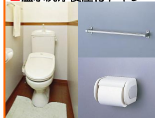
■温水洗浄便座付トイレ