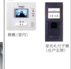
■モニター付インターホン