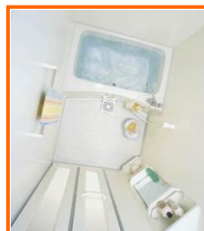
■ユニットバス (1116タイプ)