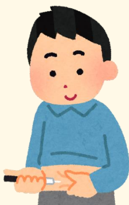
（インスリン自己注射）